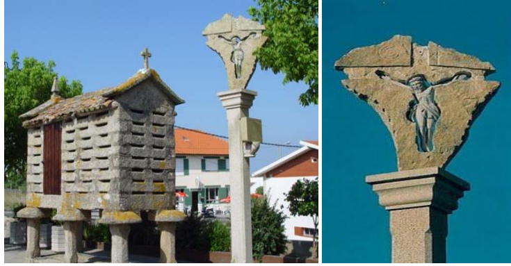
Cruceiro do adro da Igrexa do Carme do século XX (Aguiño)