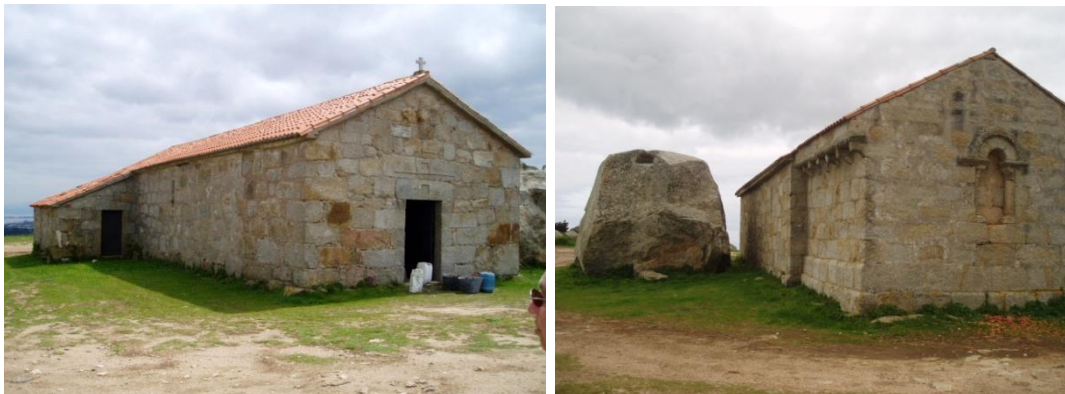
Ermida de San Alberto

Ermida románica do século XII que se atopa a 174 metros de altitude. Precisamente neste outeiro antes houbo un castro que logo foi cristianizado. Esta pequena capela conserva da súa fábrica orixinal románica o presbiterio do século XI, construída en honor a San Alberte, protector de mariñeiros e labradores. O resto da nave pertence ao século XVIII ao igual que a sancristía que se engadiu nun lateral do presbiterio, e na que foron reciclados materiais doutra capela.