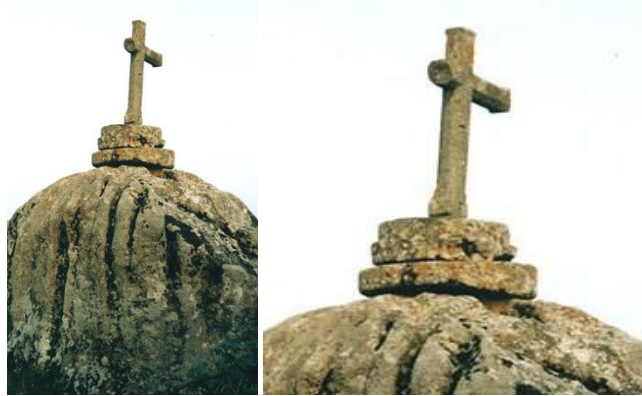
Cruz de Aguiño

Coordenadas GPS: N42.31.476 - W09.01.275.