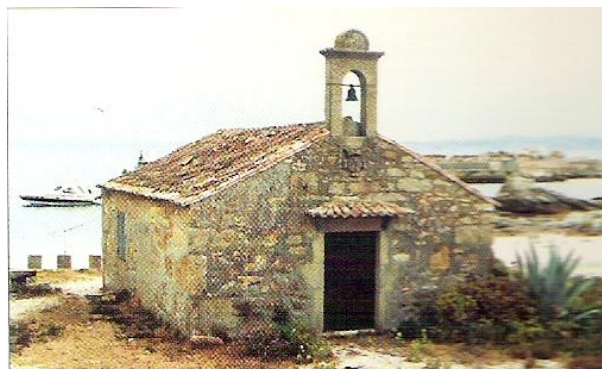
Capela de Santa Catalina

A actual Capela de Santa Catalina situada na Illa de Sálvora, era antigamente a cantina onde se reunían os habitantes do poboado desta illa.