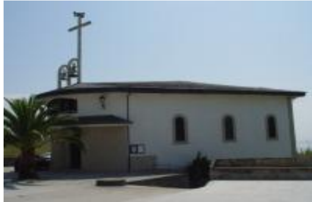
Igrexa do Bon Pastor (Castiñeiras)

Castiñeiras é parroquia eclesiástica desde 1967 e o seu templo principal era a capela do colexio do Sagrado Corazón, establecido polas Irmáns desta orde entre 1917 e 1983. Deseñada polo arquitecto José A. Franco Taboada, esta igrexa de planta oval garda relación coa cultura do traballo, a través da súa decoración interior. Entre as pezas máis valiosas conta cun gran Cristo no retablo, obra de Alfredo de Santiago.