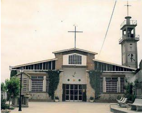
Igrexa recién construída