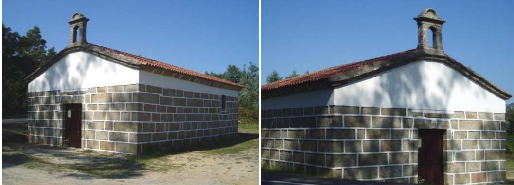
Capela de San Roque

Abandonouse o seu culto, por diversas causas, entre as que decata un preito entre os veciños de Santa Uxía de Ribeira e San Paio polos lindes de ámbalas dúas parroquias (1816). Máis tarde arranxárase ata retomar a festividade do 16 de agosto, onde numerosas persoas asisten á romaría campestre que se celebra nesta capela.