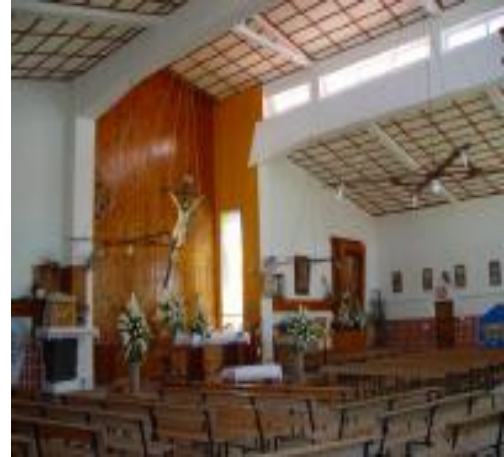
Detalle do interior