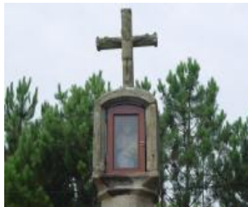
Cruceiro de O Viso

Atópase na aba dunha pequena elevación do terreo, nun claro rodeado de arborado en pleno medio rural da parroquia de Oliveira, que realza o monumento. Consiste nunha cruz con furna sobre piar octogonal e base ortogonal en chanzos. O conxunto aseméllase ao consagrado á Virxe da Saúde no Castelo, en Santa Uxía. A escasa altura permitía depositar as esmolos dentro da furna.