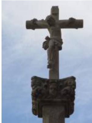
Cruceiro de Banda ao Río

Este cruceiro atópase no barrio de Banda ao Río, o xerme do casco vello de Santa Uxía de Ribeira e barrio por excelencia dos pescadores e mariñeiros. Este cruceiro de construción e forma recente presenta unha crucifixión con sinxeleza, só adornada cun capitel barroquizante no que se observan volutas entrelazadas, motivos vexetais e unha faciana dun anxiño en cada cara.