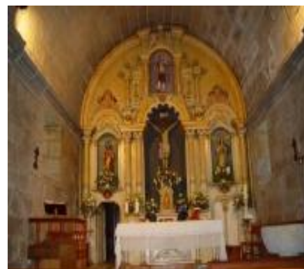
Detalle do altar e retablo interior

Coordenadas GPS: N42.32.940 - W09.00.360.