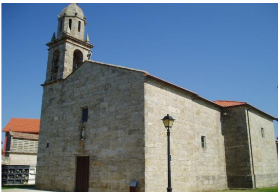
Igrexa de San Paio

Un incendio a comezos do s. XX queimou o primitivo retablo maior barroco; un lóstrego xa tiña destruído a torre do campanario en 1818, e o mestre canteiro que o estaba a refacer faleceu nun desafortunado accidente ao caer dende o tellado xusto antes de colocar o remate.