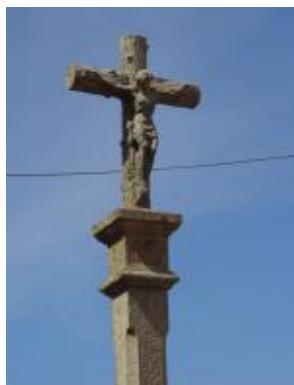
Cruceiro do Cristo dos Aflixidos

Está situado en Montevixán, o corazón urbanizado de Carreira. Esta cruz sobre columna octogonal é un dos máis recentes cruceiros do municipio. Aínda que perde o encanto das figuras traballadas artesanalmente, ten una grande forza expresiva.