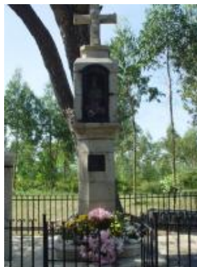
Cruceiro da Santa de Moldes

Situado no lugar de Moldes, ao pé da estrada cara a Curota ou a Pobra atópase este peto de ánimas, unha manifestación da arte popular destinada a recoller sufraxios e esmolos polos condenados. Deste cruceiro e peto de ánimas con imaxe, destaca a sinxeleza coa que se tratou a temática: unha representación da Virxe, na súa dobre faceta de Nai e Raíña, e do Neno no seu colo, protexido e ao mesmo tempo protector ou salvador do mundo. Mediante a policromía o conxunto consegue unha grande expresividade facial; os trazos curvos e os enormes ollos das figuras acadan unha expresión doce, lonxe de calquera hieratismo dramático. Este conxunto pode adscribirse a unha orixe máis artesanal e popular. Por iso é o centro dunha das romaxes máis importantes e a que máis veciños acolle en todo o municipio.