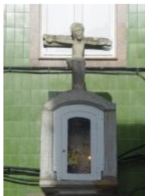
Cruceiro do Castelo

Situado no barrio do Castelo, en pleno casco urbano de Santa Uxía de Ribeira, preto da praza de abastos, pasa por ser un dos monumentos deste tipo máis emblemáticos da vila, dedicado á Virxe da Saúde xa en 1867. Trátase dunha cruz sobre furna e columna octogonal, coa base disposta en chanzos de dúas vertentes. A súa escasa altura confírelle un aspecto rudo pero de indubidable beleza pola súa imaxinería e estilo.