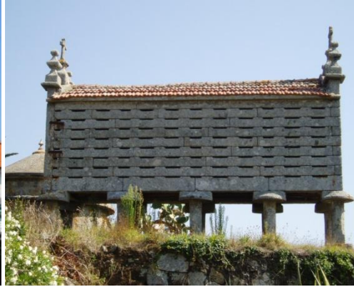
Hórreo en Frións (Carreira)

Coordenadas GPS (Hórreo Aguiño): N42.31.543 - W09.00.964.