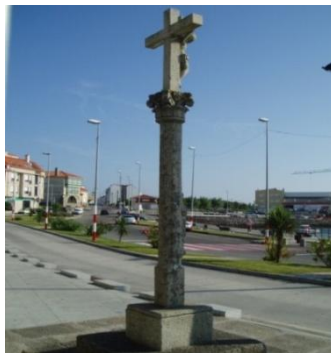
Cruceiro do porto do século XVIII

Coordenadas GPS (Cruceiro Igrexa): N42.31.543 - W09.00.964.