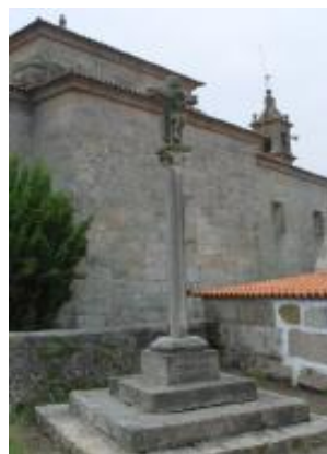
Cruceiro do Outeiro

Situado no lugar de Outeiro, na parroquia de Artes e xusto ao carón da igrexa e do cemiterio. Presenta unha cruz sobre capitel e columna hexagonal de grande beleza. Tamén o caracteriza a dupla frontalidade, coma o cruceiro de Frións.