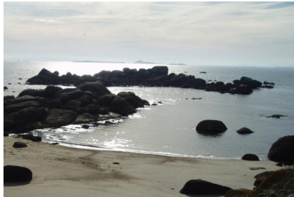
Ao fondo, lugar onde estaba a “Cruz de Couso”.

Antes de que se quitase, servía aos pescadores como referencia para localizar caladoiros e roteiros de pesca. Ademais, nesta zona encontrábase o antigo porto onde varaban as dornas os mariñeiros de Aguiño.