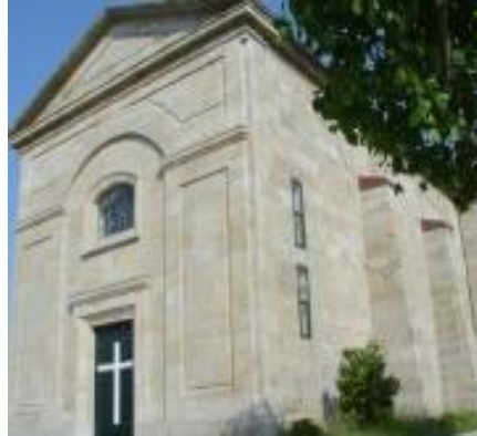
Igrexa de Santa María

Construída no ano 1967, a imitación do estilo clásico, foi situada no lugar da Agra, unha rexión equidistante entre as dúas parroquias que foran fusionadas por tales datas: Oleiros e Olveira. Levantada en cantería sobre unha base en cruz, ten unha lonxitude duns 30 metros. No altar consérvanse unhas reliquias dos santos mártires de Nectario e Victorina, que datan do século III.