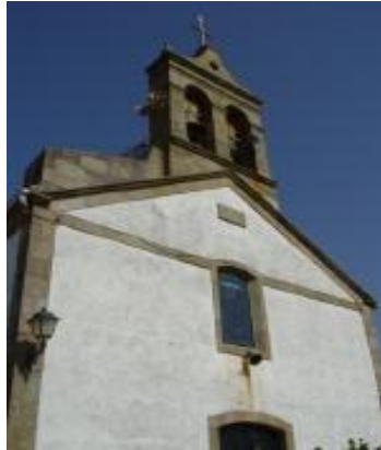
Igrexa de Corrubedo

Este templo neoclásico data de 1907 cando Corrubedo se incluía na parroquia de Olveira. Corrubedo alcanza a súa independencia en 1928. O acceso a esta igrexa faise entre as vivendas e rúas labirínticas do pobo. Conta cun pequeno adro. A anterior igrexa ocupaba o mesmo solar, e a nova foi edificada polo mestre canteiro J. Rey Bretal.