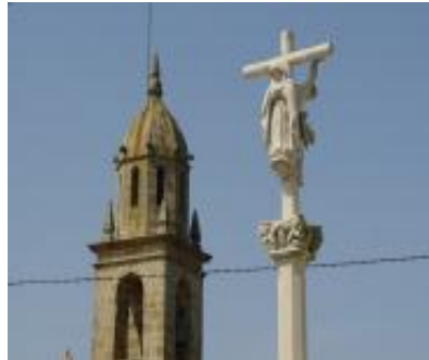
Cruceiro de Frións

Situado no barrio de Frións, ao carón da igrexa de San Paio de Carreira. Ao igual que o Cristo dos Aflixidos, pertence á escola moderna que aposta polo perfeccionismo anatómico e a carga dramática. Consiste nunha base ortogonal disposta en chanzos, unha columna hexagonal e un chapitel composto de facianas de anxiños e de volutas que soportan a cruz.