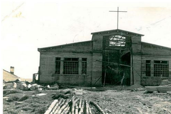
Comezo das obras da Igrexa de Aguiño

A súa construción comeza en 1959, no momento en que Aguiño se segrega como parroquia de San Paio de Carreira.