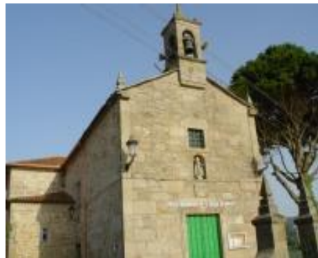
Igrexa de San Martiño

"O cura de San Martiño, éche moi bo confesor, que confesa coa criada, debaixo do cobertor".