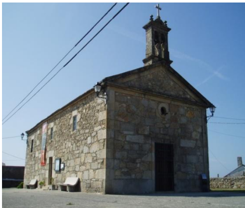
Capela da Nosa Señora da Guía

A nova capela serviu como amparo orientación e "guía" aos homes do mar de Aguiño.