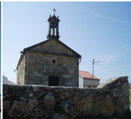
Detalle do muro e fachada principal

Actualmente, entorno a esta capela celébrase a romaría da Guía o luns de Pentecostes citada xa en documentos no século XV, e lémbrese a queima de embarcacións vellas no adro da igrexa para bendicir as novas.