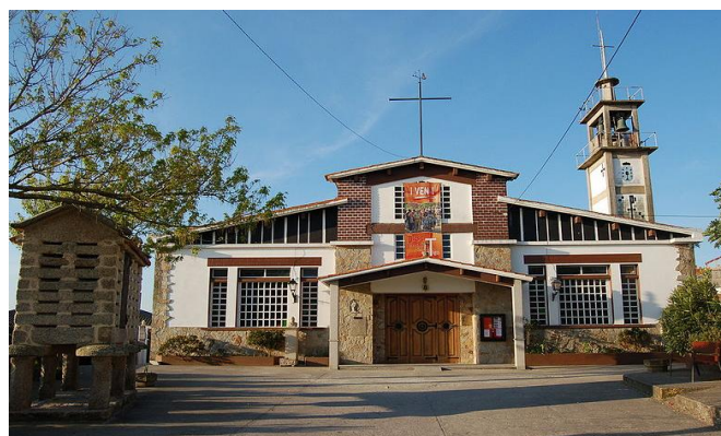
Fachada principal da Igrexa do Carme

O edificio é obra do arquitecto Antonio Tenreiro Bonachón, e foi inaugurado en 1967 como o primeiro templo da era moderna que conta con inscricións realizadas en galego. Ademais, presenta un aspecto moderno e unha disposición moi funcional na que se poden dar cita preto de 500 fieis.