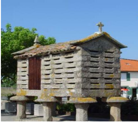
Hórreo no adro da Igrexa de Aguiño