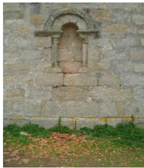
Fiestra onde se lanza a tella

"A San Alberte bendito non lle veño pedir pan, véñolle pedir un home que faga tremar o chan".